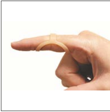
Mål: Omkreds fingerled.