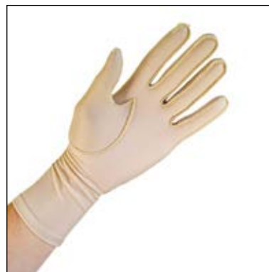
Mål: Omkreds MCP-Led.