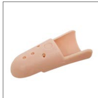
Mål: Omkreds PIP-led