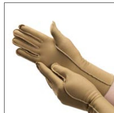
Mål: Omkreds MCP-Led.