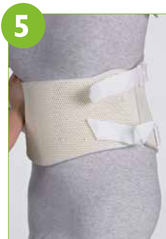
Modeller forreste del på patienten.