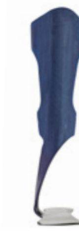
BlueROCKER® 2 ½