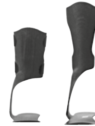
Babystørrelser Større størrelser

Sammenlignet med Flow giver KiddieGAIT® mere stabilitet i sagittal retning.