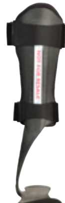
ToeOFF® FLOW 2½ ToeOFF® 2½ ToeOFF® 2.0