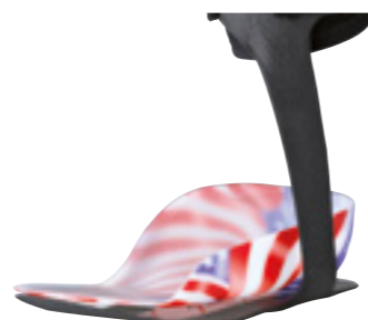
KiddieGAIT® med UCB