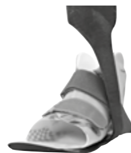
KiddieGAIT® med Surestep™