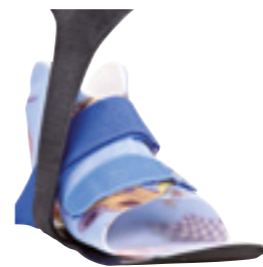
KiddieGAIT® med SMO

KiddieFLOW™, KiddieGAIT® og KiddieROCKER® skal i de fleste fall kombineres med en fothylsa som kan kontrollere fotens position.