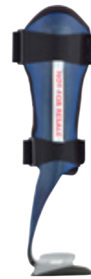
BlueROCKER® 2½ BlueROCKER® 2.0

Findes som enkelte eller som "6-pack" (small, medium og large - venstre og højre)